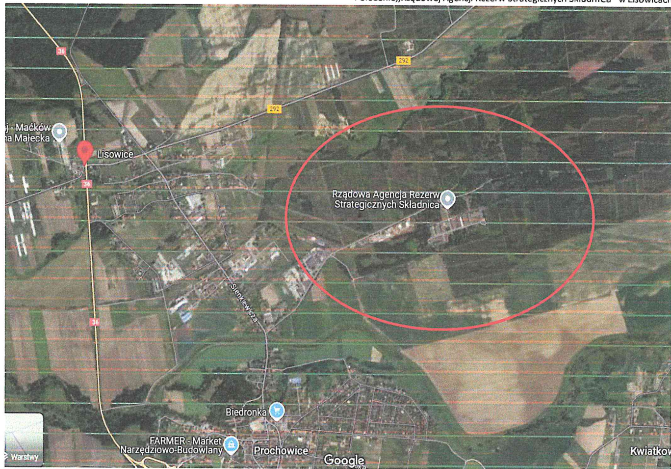
Położenie „Rządowej Agencji Rezerw Strategicznych Składnica” w Lisowicach

Obecne ciągi komunikacyjne przechodzą bezpośrednio przez centra miejscowości, gdzie znajdują się liczne zabudowania, szkoła, przedszkole, postrunek policji, tartaki oraz różnego rodzaju firmy usługowe. Ponadto jedna z tras obejmuje przejazd przez most o dopuszczalnej masie całkowitej 15 ton. Na załączonych fotografiach można zobaczyć trasy przejazdu oraz aktualny stan techniczny mostu.