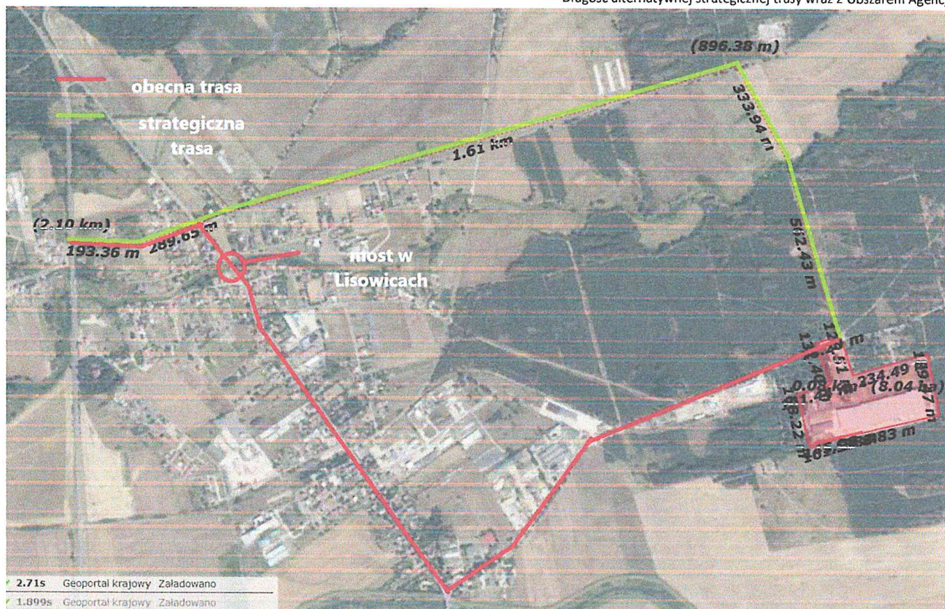
Długość alternatywnej strategicznej trasy wraz z obszarem Agencji

Długość całej trasy wynosiłaby około 3 km bezpośrednio z drogi krajowej 36, z czego 2,1 km jest poprzez aktualną drogę wojewódzką 292. Brakujący odcinek to około 900 m są to, częściowo grunty gminne gdzie jest wytyczony pas drogowy o szerokości 4 m (około 330 m), a następnie tereny należące do lasów państwowych (około 560 m).