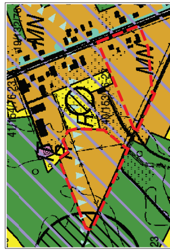
STUDIUM UWARUNKOWAŃ I KIERUNKÓW ZAGOSPODAROWANIA PRZESTRZENNEGO MIASTA I GMINY PROCHOWICE UCHWAŁA NR XL/206/2021 Z 25.08.2021R