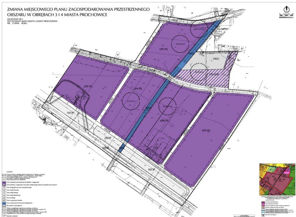
Tereny objęte zmianą mpzp.

Z formalnego punktu widzenia prognoza powinna być dokumentem sporządzanym równolegle z projektem miejscowego planu zagospodarowania przestrzennego, dla którego ma określić te ewentualne zmiany w środowisku, które wiążą się z dopuszczeniem przez mpzp konkretnych warunków i kierunków zagospodarowania przestrzennego poszczególnych terenów gminy. Zgodnie jednak z zasadą dobrej praktyki, w dziedzinie ocen oddziaływania na środowisko polityk, planów i programów, w rzeczywistości ocenie podlegał wstępny projekt dokumentu, tak aby możliwe było wprowadzenie w nim zmian wynikających z analiz wykonanych w ramach przygotowywania prognozy oddziaływania na środowisko.