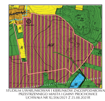
STUDIUM UMIESZCZENIA I WYKONANIA ZACZESNIOWANIA PRZESTRZENNEGO MIASTA I GMINY PROCHOWICE UCHWAŁA NR XL/200/2021 Z 25.08.2021R