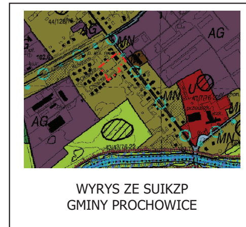
WYRYS ZE SUIKZP GMINY PROCHOWICE