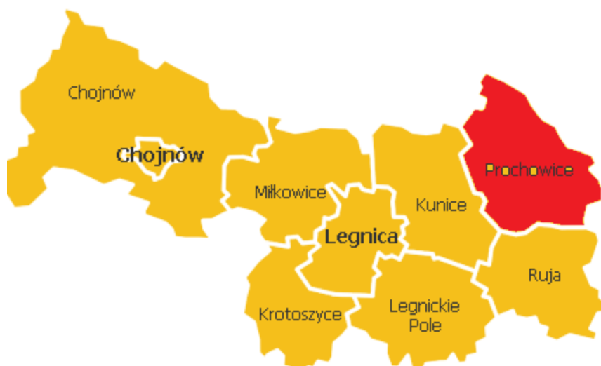
Rycina 1. Położenie Gminy Prochowice na tle powiatu legnickiego.

Gmina miejsko – wiejska Prochowice położona jest w centralnej części województwa dolnośląskiego na wysokości od 95 do 142 m npm. Powierzchnia miasta i gminy wynosi 10262 ha (w tym miasta Prochowice – 984 ha), to jest 103 km 2 , co stanowi 13,78 % powierzchni powiatu legnickiego oraz 0,51 % powierzchni województwa dolnośląskiego. Najwyżej położonym punktem w gminie jest zlokalizowane w jej południowej części wzniesienie o wysokości 142,7 m npm. (na południe od wsi Dąbie i Cichobórz), zaś najniżej usytuowany jest obszar położony wzdłuż koryta rzeki Odry (95,6 m npm.). Współrzędne geograficzne wynoszą 51° szerokości geograficznej północnej oraz 16° długości geograficznej wschodniej.